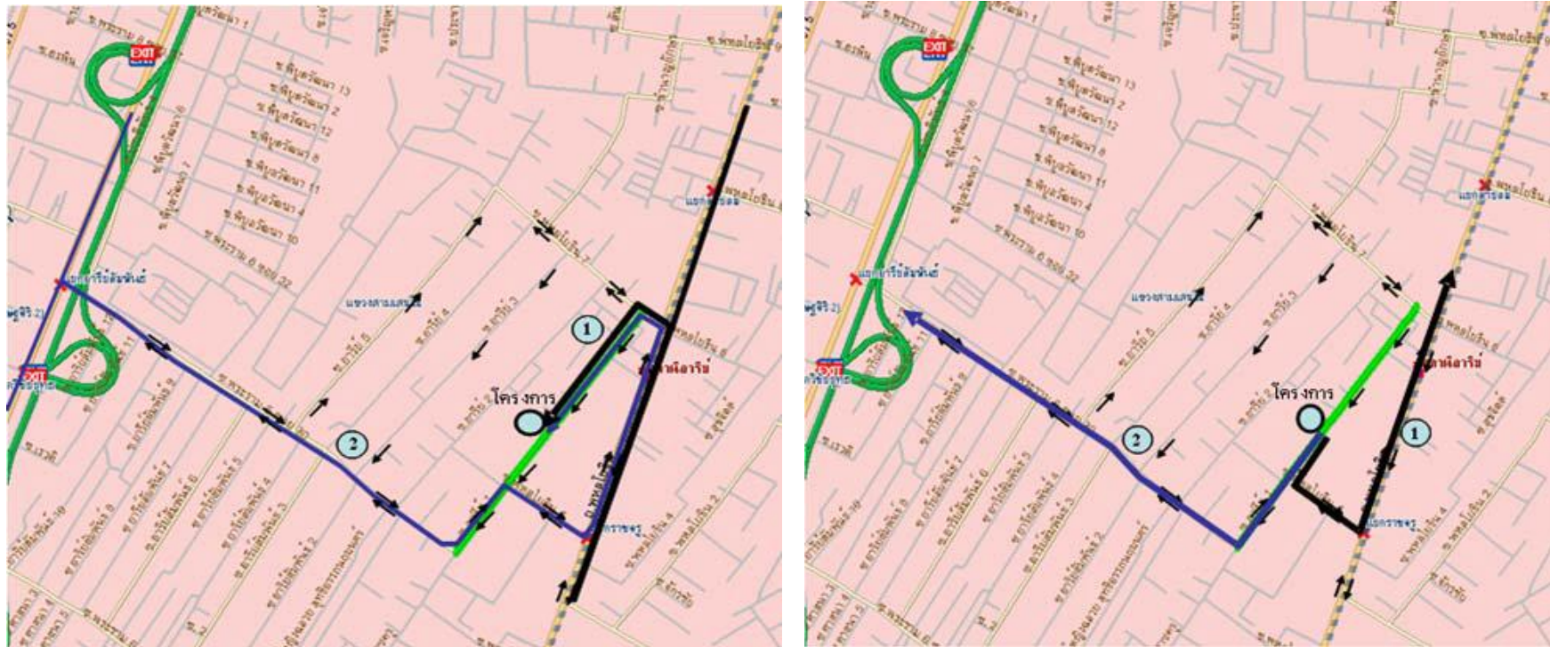
อ้างอิง : ข้อมูลจากรายงานการประเมินผลกระทบสิ่งแวดล้อม (EIA) ของโครงการ